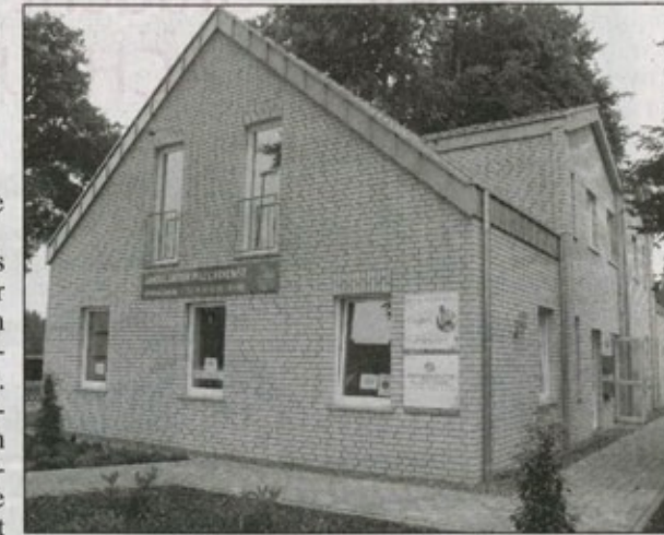
Die neue Adresse des „Physiocenter Wassenberg“: das Service-Center an der Gladbacher Straße.

Nicht nur das Service- abschnitt sowie am Alten- Center, auch die Bungalows des ersten Bauabschnitts sind ab dem 1. September alle bezogen. Die Arbeiten am 2. Bau-